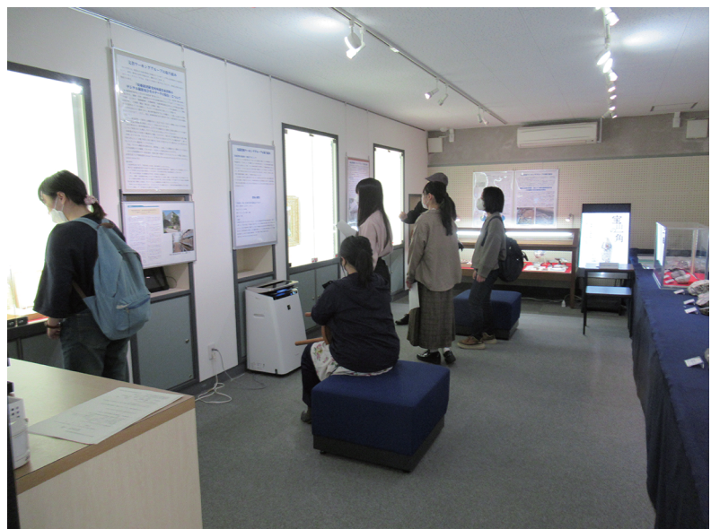
写真6 展示見学の様様