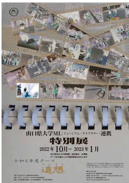
写真3 特別展ポスター

令和2(2020)年度以降、梅光学院大学博物館の閉館により、当事業への博物館参加は当館のみとなっている。梅光学院大学博物館は、平成22(2010)年度の大学博物館連携事業から山口県大学ML連携事業の発足、発展までともに歩んだ盟友だった。当事業の当初目的の一つは、「大学図書館(文字研究)と大学博物館(モノ研究)は同等に必要という認識を学内外に広めること」、そして「大学博物館設立の気運を高めること」であったが、大学博物館が必要という認識すら風前の灯火に思われる。事業を立ち上げた者として責任を感じるが、残された大学博物館施設としての歩みを全うしたい。