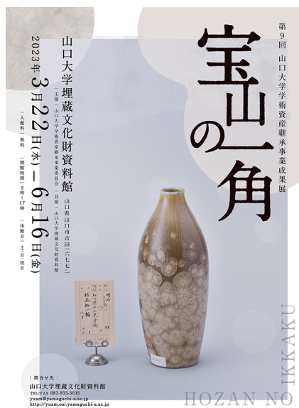
写真5 展示ポスター

全学的事業の可視化は説明責任を果たす上では必須であることから、当館は今後も全面的にその活動を支援していきたい。