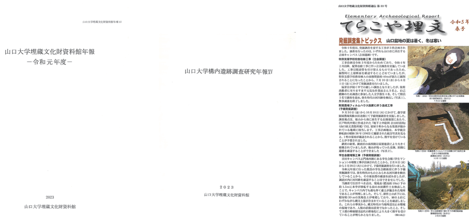
写真 13 令和4年度埋蔵文化財資料館刊行物

平成17(2005)年から発行している速報性を重視した広報誌であり、平成23年度以降は年度末に1冊の刊行となっている。巻頭頁に当該年の発掘調査成果、2-3頁に展示活動報告、4-5頁に遺跡めぐりサイクリングコース「秋吉台1周」の紹介記事、6頁に山口博物館との共催事業「古代ウォーク」実施報告、7頁に「資料館この一品」として吉田遺跡出土の円面硯、8頁に令和4年度の全活動記録を掲載している。