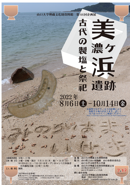
写真1 企画展ポスター

展示期間は令和4年8月6日(土)から令和4年10月14日(金)で、会期中181名の方々に観覧いただいた。