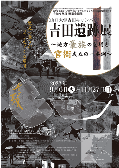
写真7 連携企画展ポスター