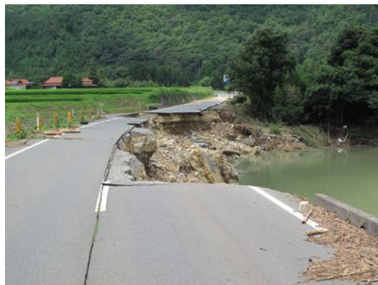
Photo1 Bank erosion by Abu-gawa River 2)

Photo 1 は、河川湾曲部外岸の被災事例として、平成 25 年山口・島根豪雨により 7 月 28 日に山口市阿東徳佐の大久保地区で発生した国道 315 号沿いの阿武川湾曲部外岸の水衝部土羽の浸食被害を示す。阿武川は写真の右上側から国道に向かって流れ、国道に衝突した後は国道に沿ってしばらく流れている。国道の川表側法面は下部が護岸で固められ、その上部が土羽となっていた。国道 315 号は阿東徳佐から嘉年上に至る区間の多くに地点で河川災害や道路・橋梁災害に見舞われた 3) 。写真に示す大久保地区では、水衝部で土羽が浸食されて道路が破壊され、その破壊が一部は川裏側の