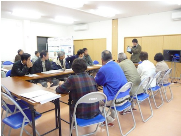
図6 電子回覧板の説明風景