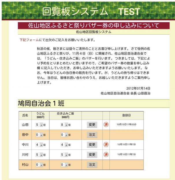
図 4 電子回覧板の画面

と災害時に避難所に指定されている公会堂などを自立的無線ネットワークでつなぎ、地域コミュニティシステム及び被災情報提供システムのフィールド実験を行った。この地域は高齢の方が多いが、防災に積極的な組織で、平成 23 年に消防庁長官表彰功労賞で山口県知事賞を受けている。実験は、同地区 3 自治会の公会堂周辺で、タブレット端末を用いた電子回覧板の回覧とタブレット端末を用いた被災情報の収集・共有・確認まで、平常時から災害発生、災害時ま