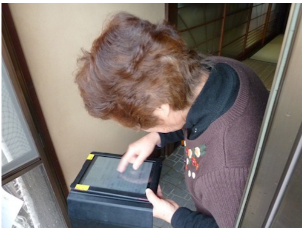
図7 電子回覧板の実験風景

「日頃から使っていないと、いざという時に使えない」という考え方に基づいて、電子回覧板を使用したことについて