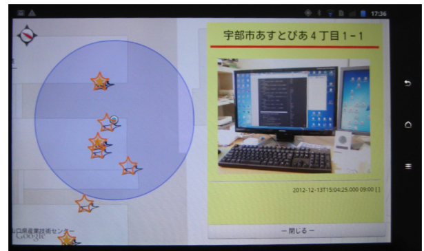
図 5 被災情報収集アプリ

と災害時に避難所に指定されている公会堂などを自立的無線ネットワークでつなぎ、地域コミュニティシステム及び被災情報提供システムのフィールド実験を行った。この地域は高齢の方が多いが、防災に積極的な組織で、平成 23 年に消防庁長官表彰功労賞で山口県知事賞を受けている。実験は、同地区 3 自治会の公会堂周辺で、タブレット端末を用いた電子回覧板の回覧とタブレット端末を用いた被災情報の収集・共有・確認まで、平常時から災害発生、災害時ま