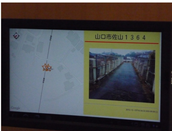
図 11 被災情報を閲覧

災情報共有システムの切り替えを住民参加のフィールド実験により確認した。被災情報共有無線ネットワークを電子閲覧板システムとして日頃から使用すれば、高齢者などの情報弱者でも本システムを熟知できることが実証された。