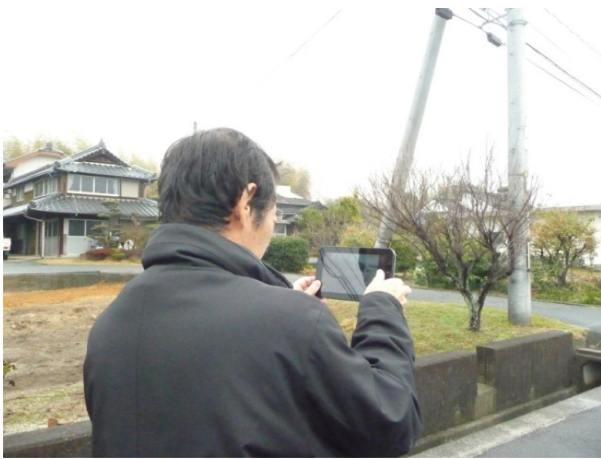
図 10 被災現場の撮影風景