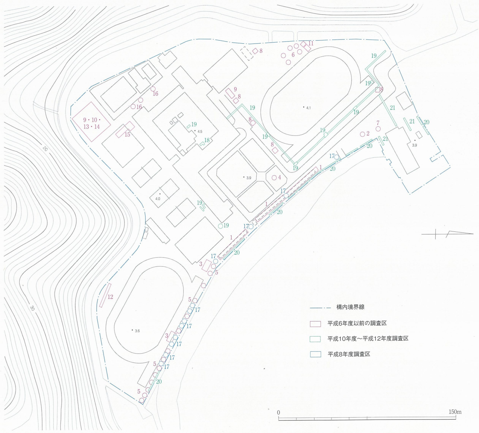
Fig.93 山口大学光構内調査区位置図