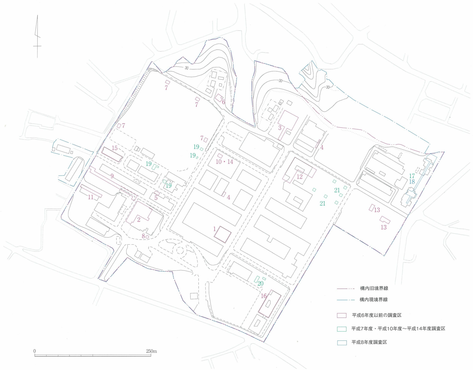
Fig.90 山口大学常盤構内調査区位置図