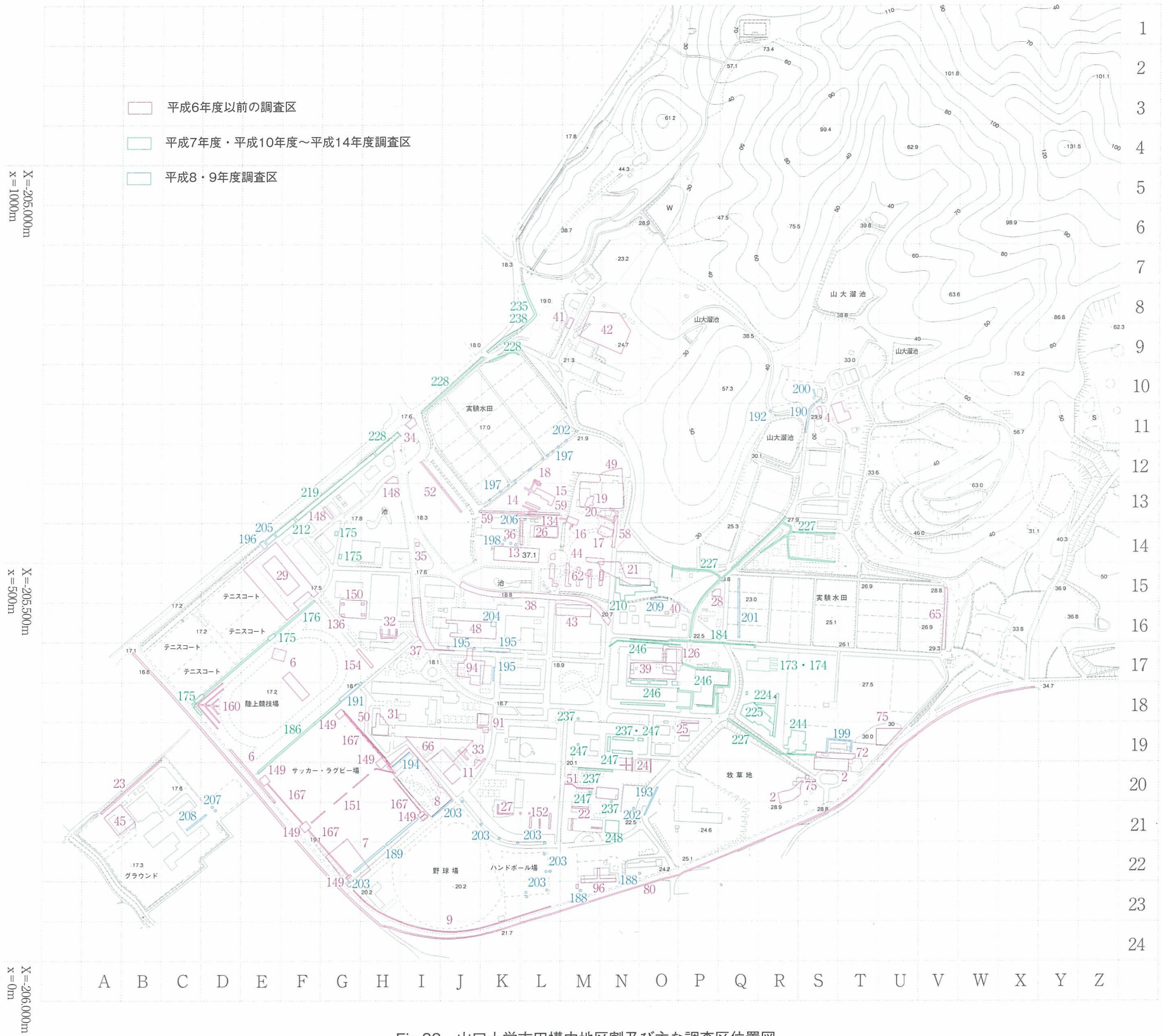
Fig.88 山口大学吉田構内地区割及び主な調査区位置図