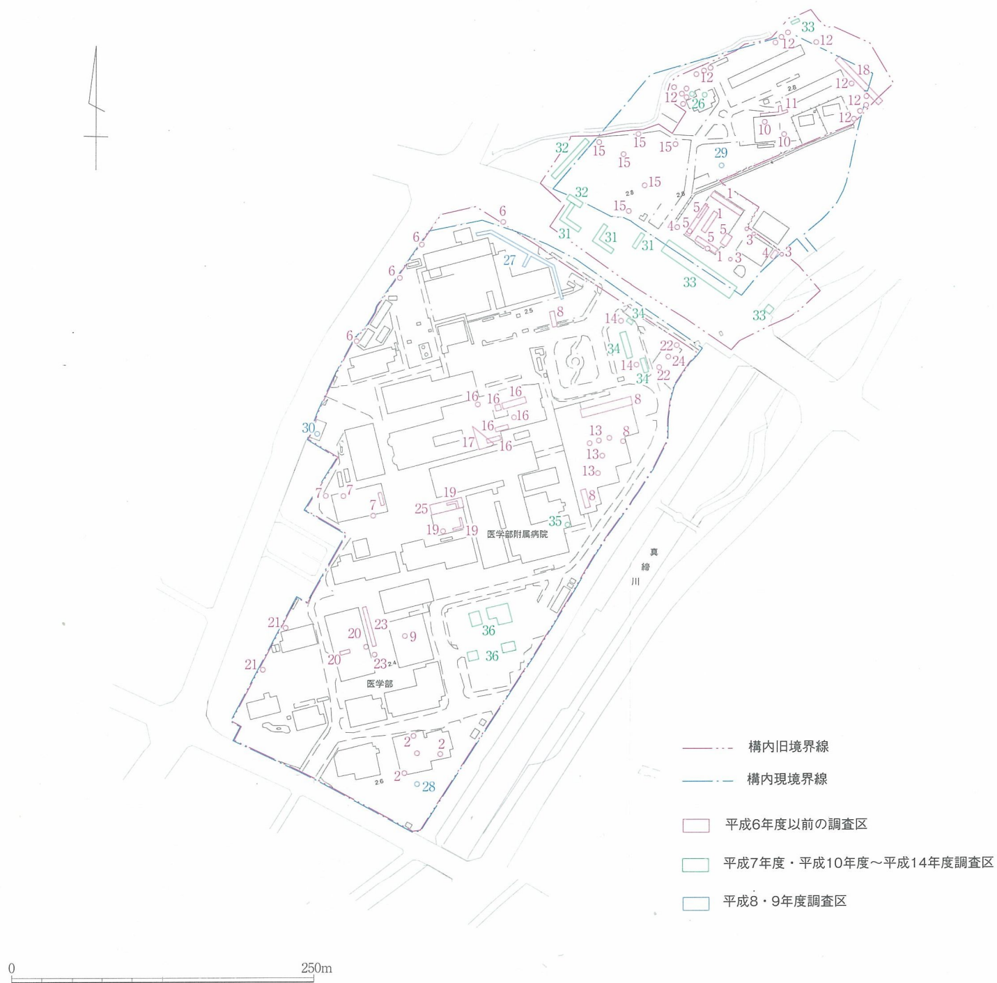
Fig.89 山口大学小串構内調査区位置図