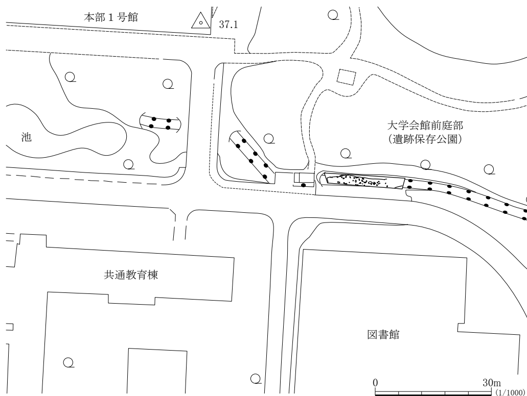
Fig.38 第 I 地区 B 区位置図

当館は平成4年度に、吉田構内への統合移転時に発掘調査が行われた吉田遺跡第 I 区 B 区の報告を行った 1) 。その際、遺構図に関しては断面図は存在したものの、平面図が全て行方不明であったため、断面図は基本層序の提示にとどめ、遺物中心の報告を行わざるを得なかった。その後、平成9年4月に至り、教育学部地理学準備室から統合移転時の発掘調査の記録類が新たに発見され、この中に吉田遺跡第 I 地区 B 区の平面図等が含まれていた。この発見により、第 I 地区 B 区の調査区とおおよその位置が明らかになった。以上の新たな発見を受け、以下では、これらの図面について追加報告を行いたい。