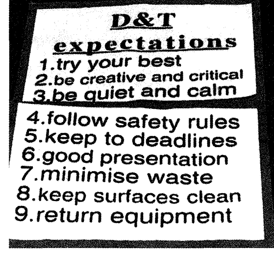
図8 技術 (DT) の授業の心得書き

図7は、学校訪問したケンブリッジ市のチェスタートン・コミュニティ・カレッジ (Chesterton Community College) (公立学校) の中等部の技術授業で、教員が卓上ボール