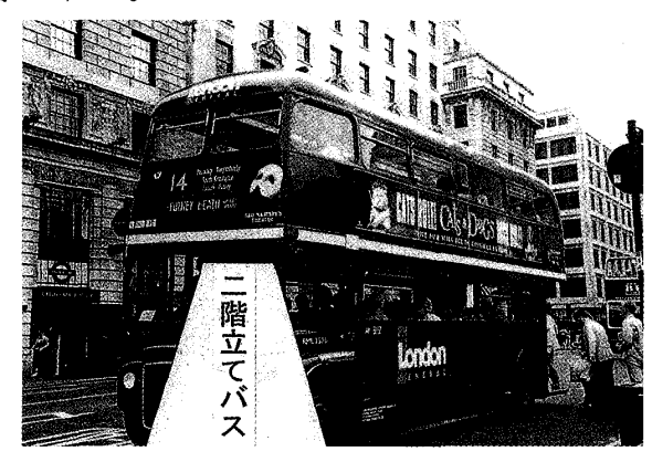
図 1 英国ロンドンの 2 階建でバス (ロンドン、Green Street にて、 2001年 8 月撮影)

図1は、英国のロンドンを走行する2階立てバスである(2001年8月撮影)。これは、昔、乗合馬車が屋根の上にも人を乗せて走っていたので、その伝統を守り、これをバスにも2階建てを採用したいきさつがある⁴)。図2は、ブラックキャブと呼ばれるタクシーである(2001年8月撮影)。昔からのボデーの形をそのまま受け継いでいる。このようなことからも英国は昔からの伝統を引き継ぐ習慣があり、教育においても古いものを大切にし、個性を尊重する、伝統を重んじる、何事にも真剣に取り組む、姿勢が背景にあるものと推察された。