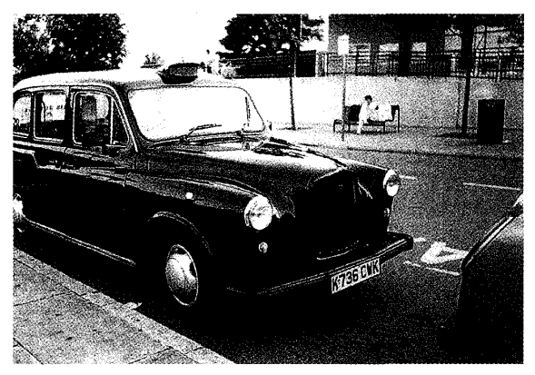
図 2 ブラック・キャブ (伝統的な英国のタクシー、オックスフォー ド鉄道駅にて、2001年8月撮影)

3.1 英国中学校の生徒手帳「Planner (プランナー)」にみられる学校のきまり