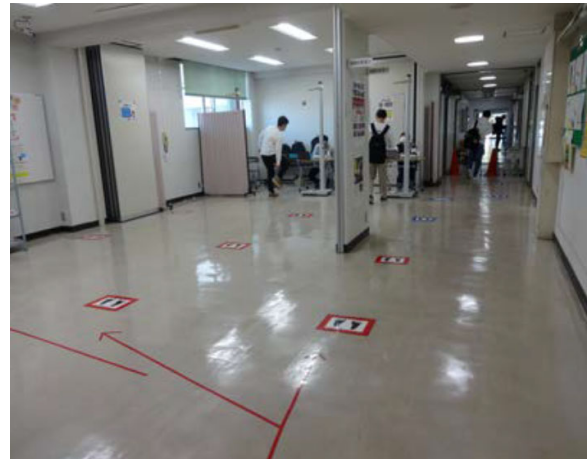
図3 間隔をあけての整列